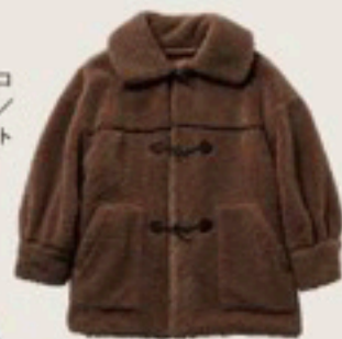
茶ボアダブルコート 11,550円/ヘザー(アダストリア)