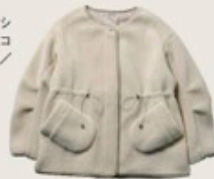
ベージュサイドシャーリングボアコート 14,080円/flower