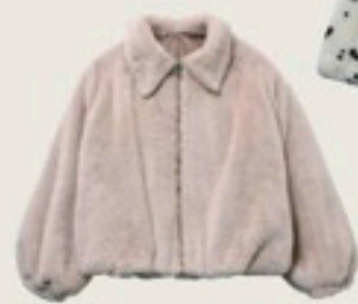
ファー入りブルゾン 3,999円/WEGO