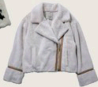
ファーライダースジャケット 20,900円/Noela