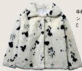
牛柄ファーブルゾン 6,599円/W♥C