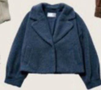
ブルービッグネリコート 15,400円/LILLIAN CARAT (リリアンカラット)